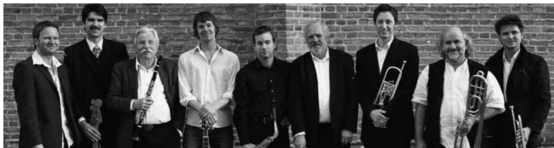
Nicht nur am Skalpell virtuos: Die FESSH-Band.